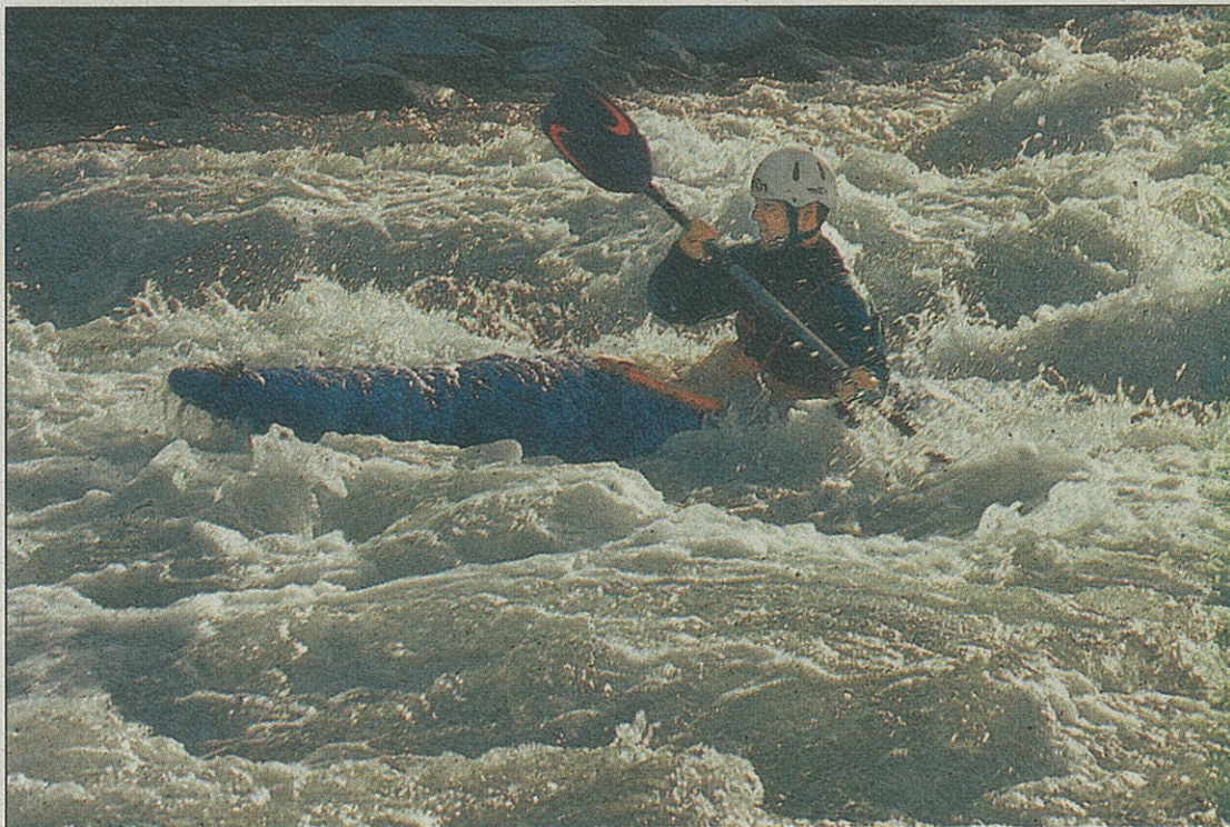
Abenteuer-Sportarten sind auch heute noch ein wesentliches Standbein des Betriebs.